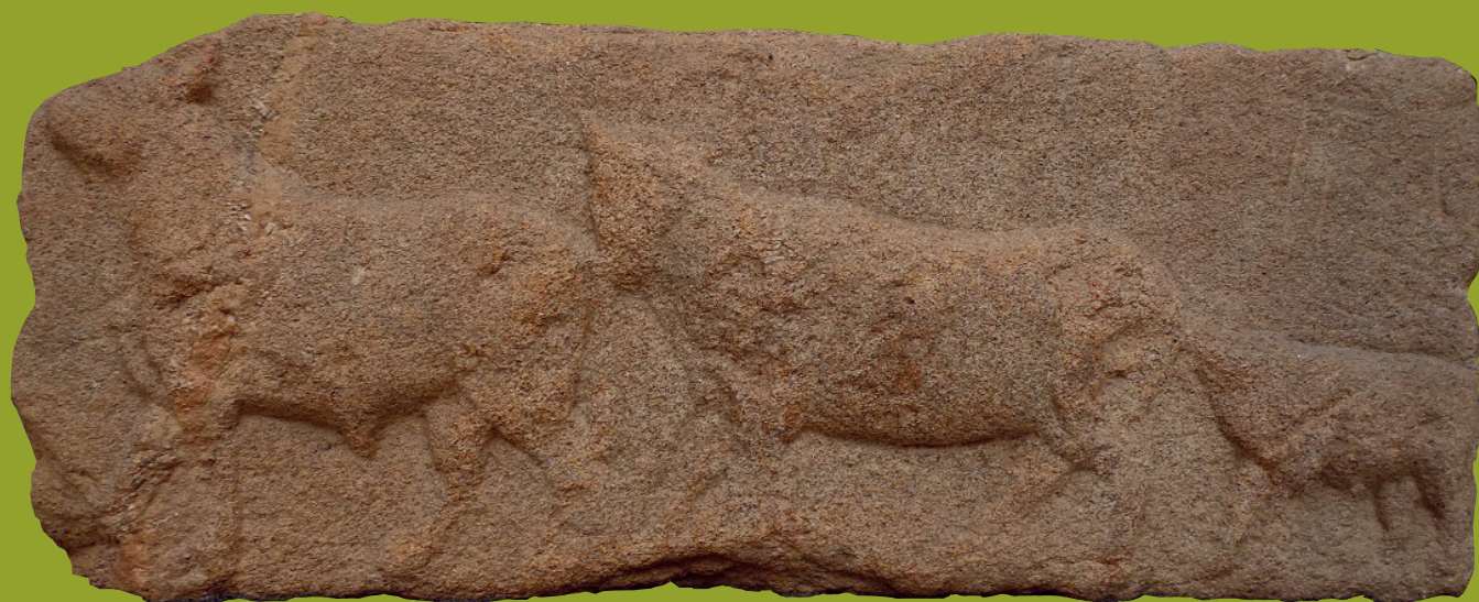
Relevo de Vilarín (S. I-II d.C.) Becerreá

www.deputacionlugo.gal | terrasdomiño.com osancareslucenses.com | arqueoancares.blogspot.com www.concellobecerreá.es | www.concellobaralla.es