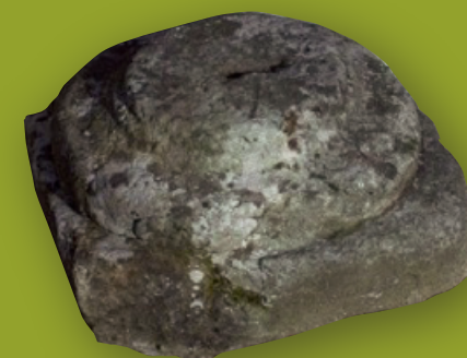
Base de columna romana Becerreá