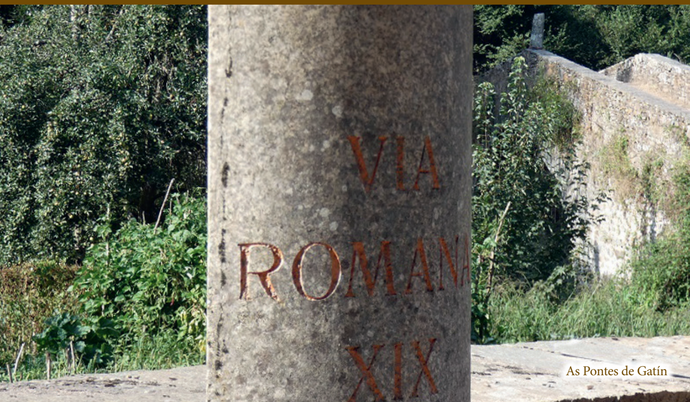
As Pontes de Gatin

Na comarca dos Ancares , a vía discorría, no concello de Cervantes , polo Comeal, Xestoso, San Miguel, Vilarello, A Ponte de Doiras, As Casas do Río, Vilanova, O Fabal, Santa Xusta, San Martín das Canadas, San Tomé de Cancelada e A Estrada, continuando, no concello de Becerreá , por As Pontes de Gatin ( mansio de Ponte Neviae), A Borquería, Ouselle ( mutatio de Vilarín), Cadoalla (asentamento do Enciñal), O Cereixal, O Casar, Todón de Abaixo e A Lagúa. Logo, xa no concello de Baralla , ía pola Ponte de Neira, A Condomiña (xacemento do Agro de Pedreda), Carballedo, A Pena, Val e A Barrosa, adentrándose, no concello de Castrolibelo , pola Abelleira onde se conserva un tramo orixinal. A grandes trazos, xa na comarca de Lugo , seguía por Pereira, Furís de Abaixo, Mirandela, Miranda, Tórdea (Castroverde), Rubial, Chavín, Ermida das Virtudes, Adai, Arxemil (O Corgo), Coeo, Viador, Conturiz e cidade de Lugo.